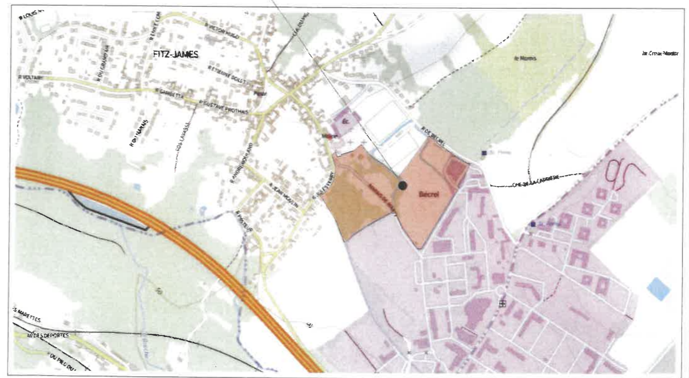
PLAN CADASTRAL éch. 1:10000 ème

Zone projet - objet de la demande de Permis de construire