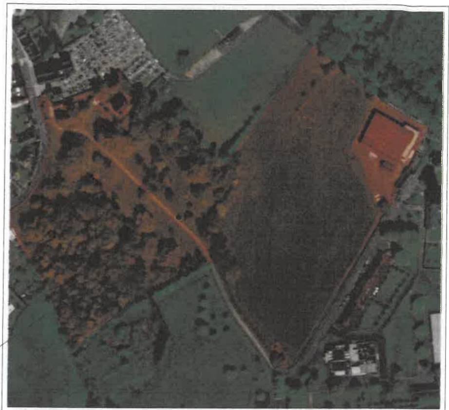
VUE AÉRIENNE sans échelle

TETRAGONE ARCHITECTURE SAS d'architecture au capital de 10 000 Euros Inscrit au tableau de l'ordre des architectes N° National S18429 N° SIRET : 820 630 952 000027 - RCS MARSEILLE 820 630 952 Code APE : 7111Z-TVA intra communautaire N° FR 82 820630952 85 Cours Pierre PUGET - 13006 MARSEILLE LG 0620328544 / YD 0603153745 ta@tetragonearchitecture.com